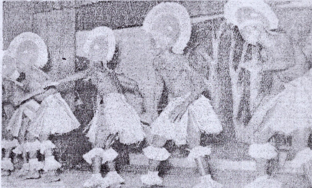
Le ballet de Macenta sur la « Forêt sacrée »

la forêt, les initiés rentrent au village, précédés par la musique sacrée du génie que seuls les tatoués pouvaient voir et approcher. L'ensemble de Macenta nous a séduit et transporté bien dans la profondeur des temps: sons mystérieux du temple de liane et de feuillage, musique qui porte aux humains la parole des dieux d'argile et de bois, chanson qui s'élève des profondeurs de l'inconnu, bref pour nous ramener à la réalité: à l'ère bienheureuse du P.D.G.: démystification des forêts sacrées qui ont livré leurs secrets à notre Parti. Forêts devenues des chantiers de jeunesse où gronde la révolution. Le décor, les couleurs, la variété du rythme, l'harmonie de l'ensemble et surtout, il faut le souligner, la communion entre les exécutants de la musique, classent le ballet de Macenta parmi les meilleurs.